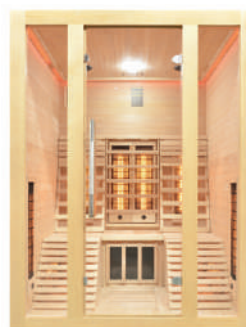
Code QD-E4R 2 personnes

ATTENTION Ne convient pas pour les Établissements Recevant du Public (ERP)