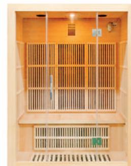
Code QD-EA3T 3 personnes