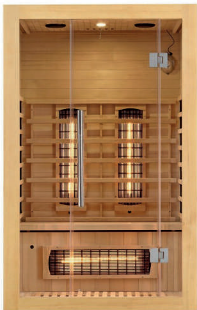
Code QD-EA2R 2 personnes